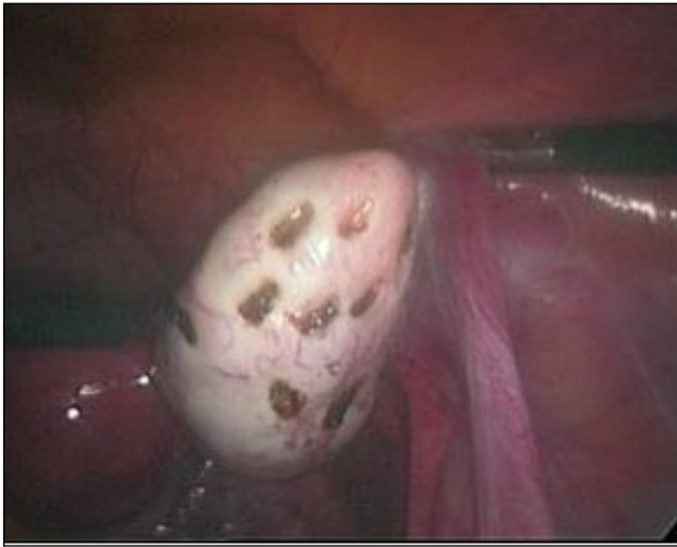
Imagen 3 Drilling ovárico