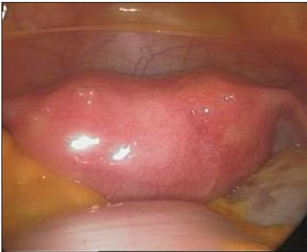
Imagen 4 Útero arcuato

cavidad endometrial. El número de miomas adquiere menos importancia en la vía de abordaje que el tamaño, la mayoría establecen un tamaño máximo de 9-10 cm (20, 21).